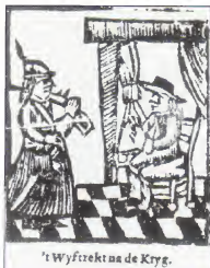
Detail uit 'Als gij dees Nieuwe Wereld ziet...', houtsnede, ca. 1800